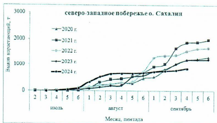
Рисунок – 1. Нарастающая динамика вылова кеты у северо-западного побережья о. Сахалин по данным СКТУ на 21.09.2024 г.

По обращению АО «Плюс» № 16.09.2024 г., от 19.09.2024 по вопросу открытия промышленного рыболовства кеты на РЛУ № 65-03-10.